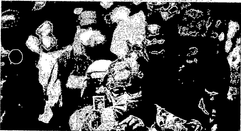
O ÓRGÃO DAS NAÇÕES UNIDAS ALEITOU QUE A REGIÃO NÃO ESTÁ CONSEGUINDO RETOMAR O CRESCIMENTO E REDUZIR A POBREZA

Os impactos sociais e econômicos da pandemia de covid-19 persistem na América Latina e no Caribe, onde a pobreza e a desigualdade se agravaram nos últimos anos. Uma "crise silenciosa" atinge o setor educacional, colocando uma geração inteira em risco, afirmou a Comissão Econômica para a América Latina e o Caribe (Cepal), em sede em Santiago, em relatório divulgado hoje. O órgão das Nações Unidas alertou que a região não está conseguindo retomar o crescimento e reduzir a pobreza, enfrentando também, no terceiro ano da pandemia, cenário de incerteza, inflação alta, crescente informalidade trabalhista e precária recuperação dos postos de trabalho. "Os impactos sociais que a pandemia trouxe não diminuíram, e a região não conseguiu retomar o caminho do crescimento", disse a Cepal. "Um segundo lugar, destaca-se o