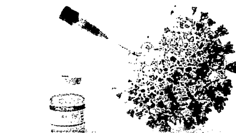
CONTRATO PREVÊ ENTREGA DE 2 VACINAS PFIZER ADAPTADAS ÀS VARIANTES ÔMICRON

Esta forma, o Brasil estaria mais preparado para enfrentar novas ondas de covid-19.