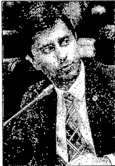
DUARTE JÚNIOR ESTÁ TRABALHANDO DURO PARA CONSEGUIR O NÚMERO NECESSÁRIO DE ASSINATURA PARA CRIAR A CPI

A proposta de Duarte precisa, no mínimo, de 171 assinaturas para ser protocolada na Mesa Diretora da Câmara dos Deputados