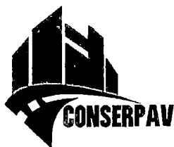
TABELA DE ENCARGOS SOCIAIS CONSTRUÇÃO DE UMA PONTE EM ESTRUTURA MISTA SOBRE O RIO BALSINHA, NA ZONA RURAL DO MUNICÍPIO DE BALSAS - MA LOCAL: BALSAS / MA

CLIENTE: PREFEITURA MUNICIPAL DE Balsa / MA TOMADA DE PREÇO Nº 07/2023