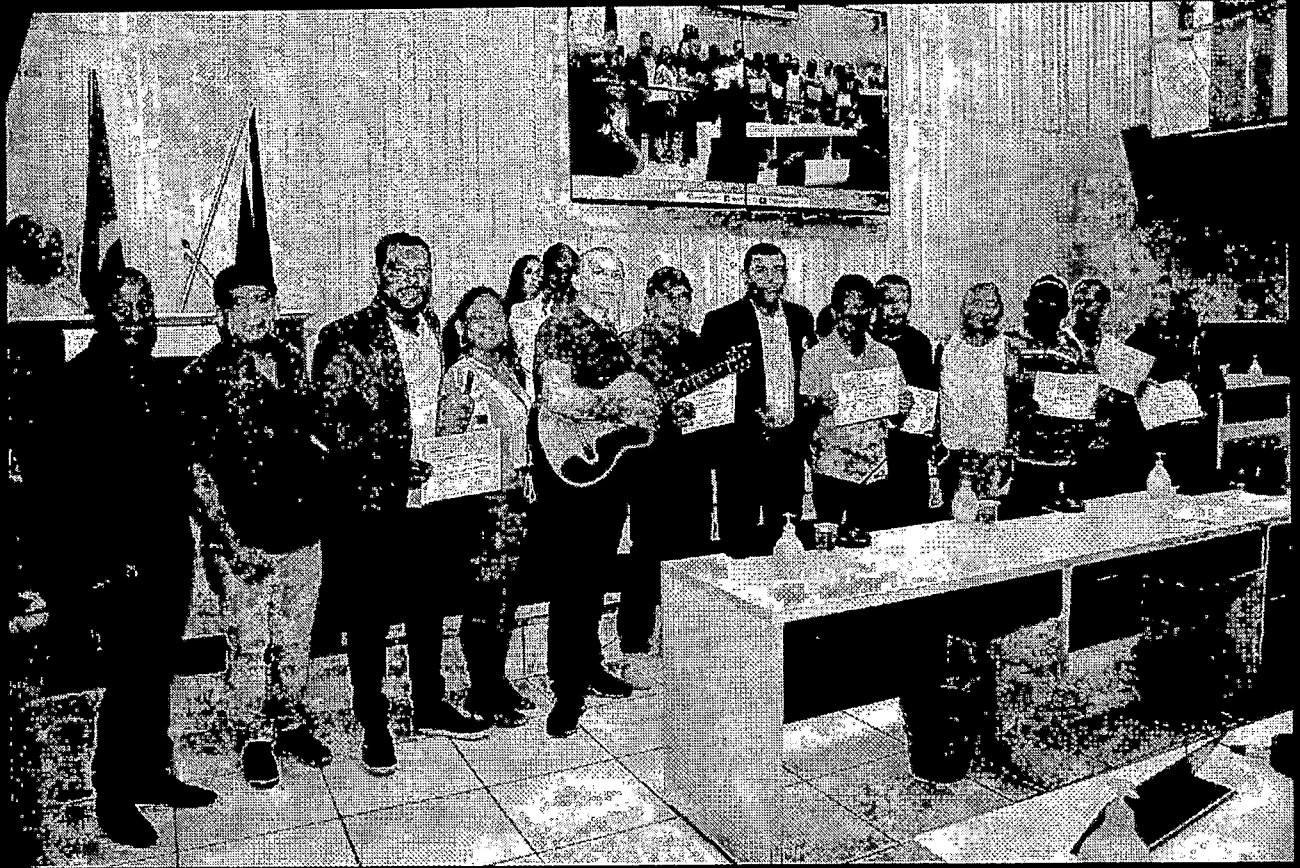
Também sou Regente da Orquestra Sanfônica Riba do Velho